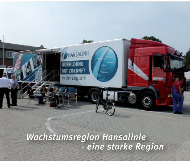
Wachstumsregion Hansalinie - eine starke Region

Querschnittsthema sind »Umweltschonende Technologien«. Für die fünf anderen Bereiche stehen Aufbau und Betrieb von Branchennetzwerken aus Unternehmen, Hochschulen und wirtschaftsnahen Einrichtungen der Region im Mittelpunkt.