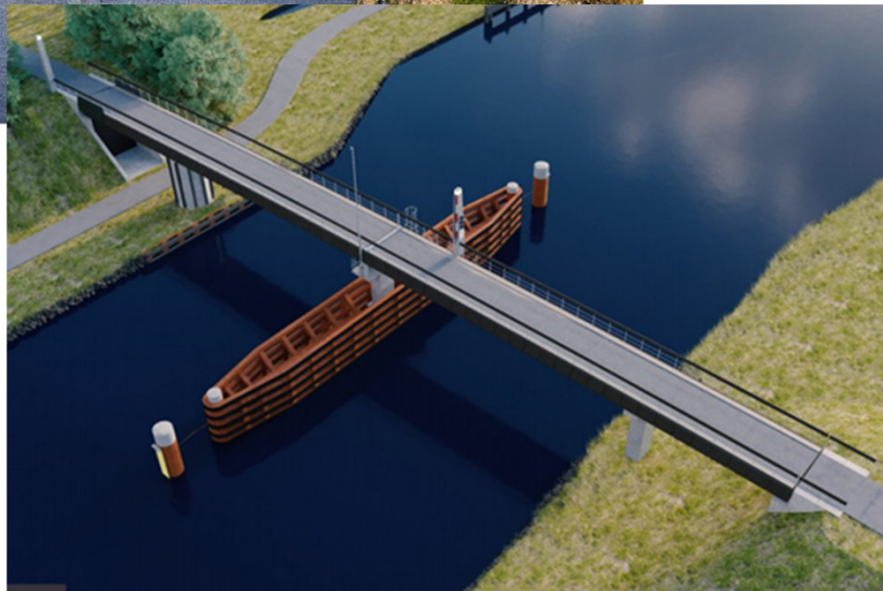
Aus biobasierten Verbundstoffen zusammengesetzte Fahrradbrücken